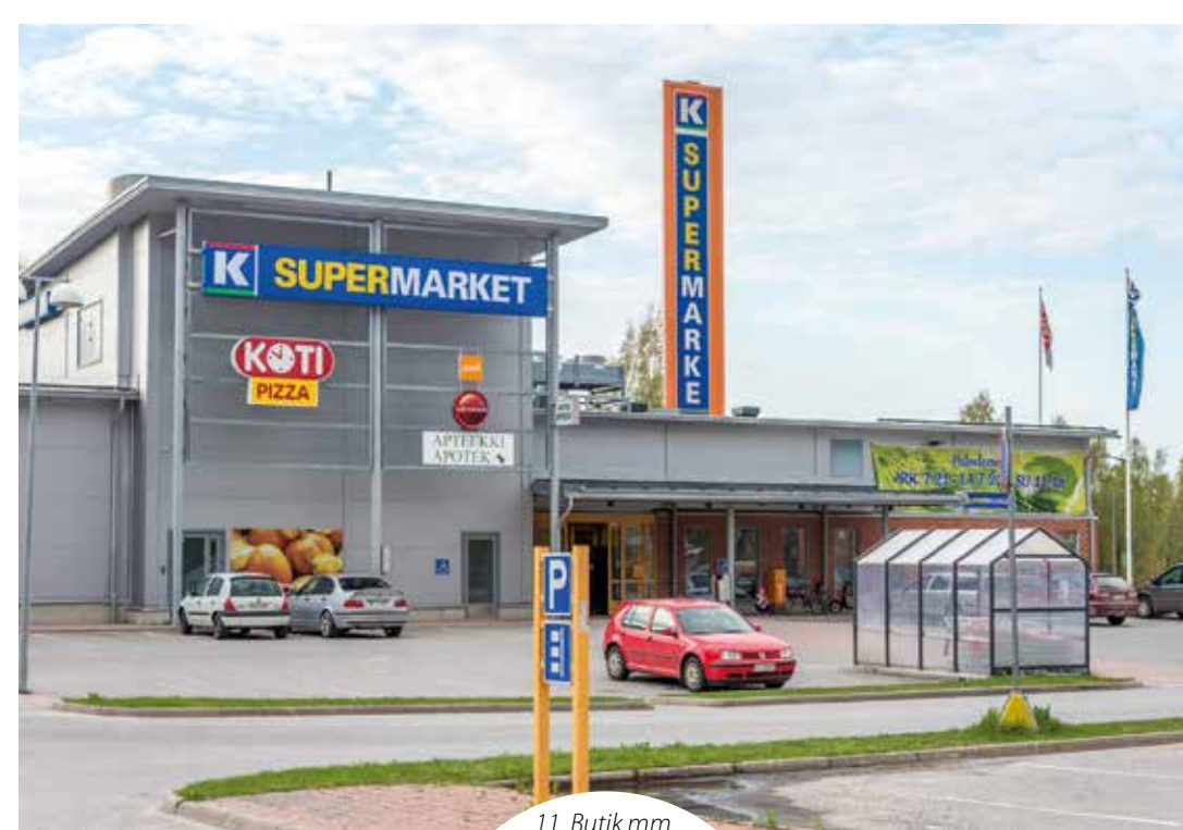
11. Butik mm.

Promenad- och cykelvägen omges av några nya höghus byggda i början av 2000-talet. Då vi vandrar längre fram går vi förbi ämbetshusets nya del och matbutiken, som båda presenteras nedan. Vill du göra rundan cirka 700 meter kortare så vänder du till höger längs Emilsvägen så kommer du tillbaka till starten på Niklasvägen.