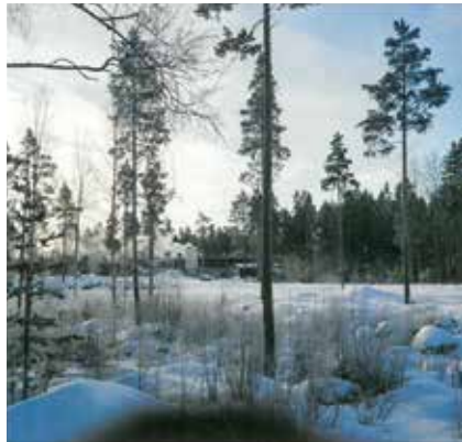
Ämbetshusets tomt 1978.

Helt i enlighet med planerna togs en fjärdedel av utbyggnaden i användning av kommunens socialvården. Även andra kommunala enheter finns här, så också Korsholms musikinstitut.