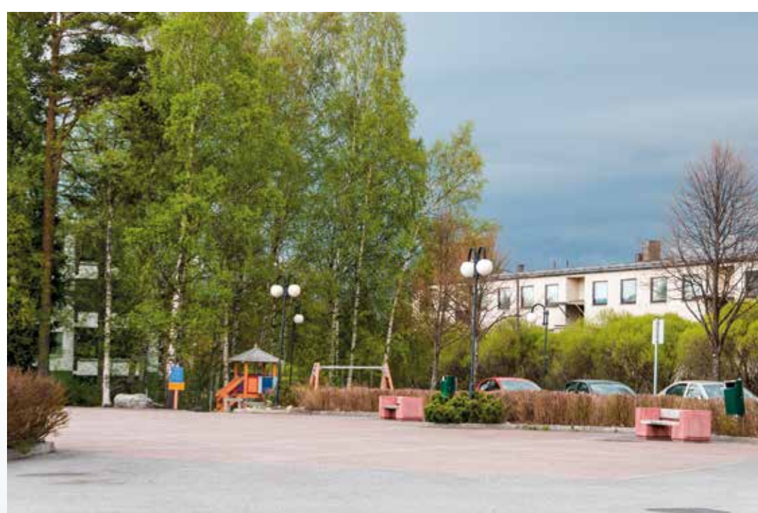
Husen i bakgrunden är vid Adamsvägen.