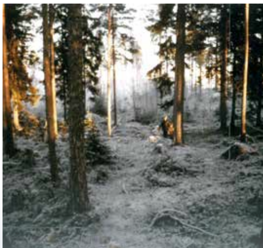
Nässkogen 1972 från Vallonias eller ämbetshusets tomt. I bakgrunden på bilden höghusen vid Olavsvägen.