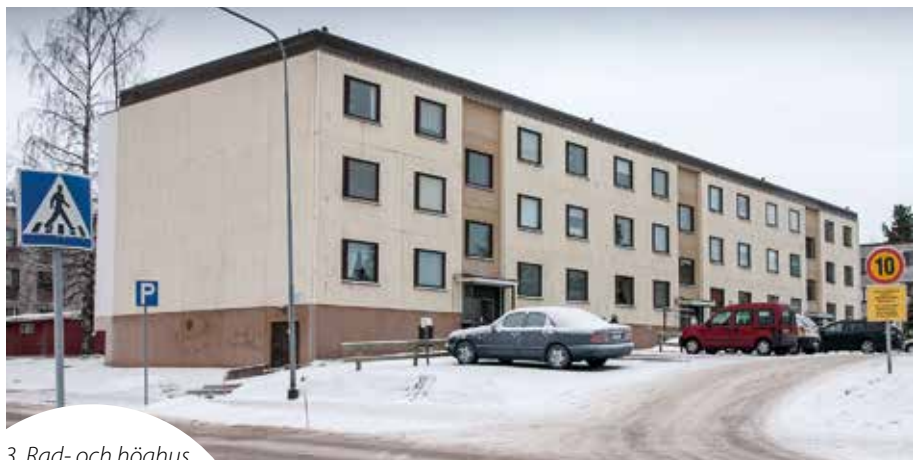
3. Rad- och höghus

Man började bygga Niklasvägen i medlet av 1970-talet. Huset på Niklasvägen 4 är det äldsta huset och är byggt vid samma tid.