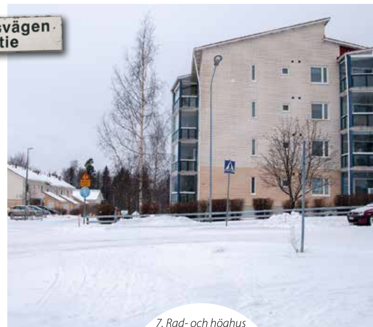
7. Rad- och höghus