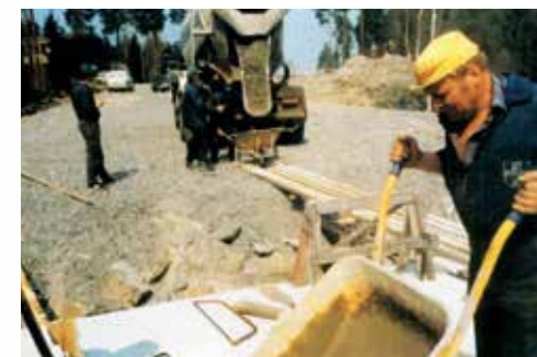
Arbete vid tunnelbygget på Centrumvägen. Bilden är från boken Smedsby 1940-2002

Går vi runt hotellet längs Torgvägen och Vallonvägen kommer vi tillbaka till Centrumvägen.