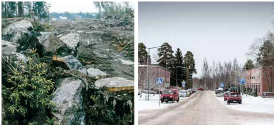
Ett foto då man började bygga Niklasvägen och till höger ett från samma plats i dag. Fotot uppe till vänster Stina Svarvar.